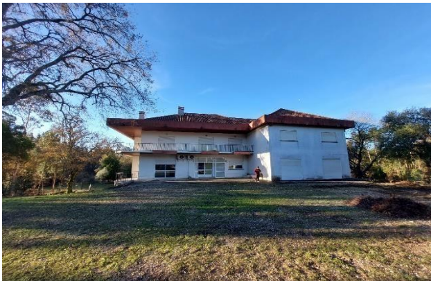
(Nhà Mẹ Lavang – mặt tiền)